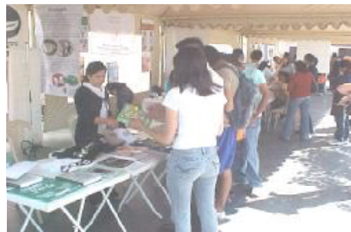
Stand del Museo Noel Kempff en la Feria del Libro Verde

El evento contó con la participación de diversas instituciones ambientalistas de nuestro medio, quienes expusieron el material bibliográfico que producen, como distintas publicaciones impresas alusivas a la conservación de los recursos naturales y desarrollo sostenible, constituyéndose en un nexo que permitió, particularmente a la población estudiantil, encontrar referencias para definir proyectos de conservación.