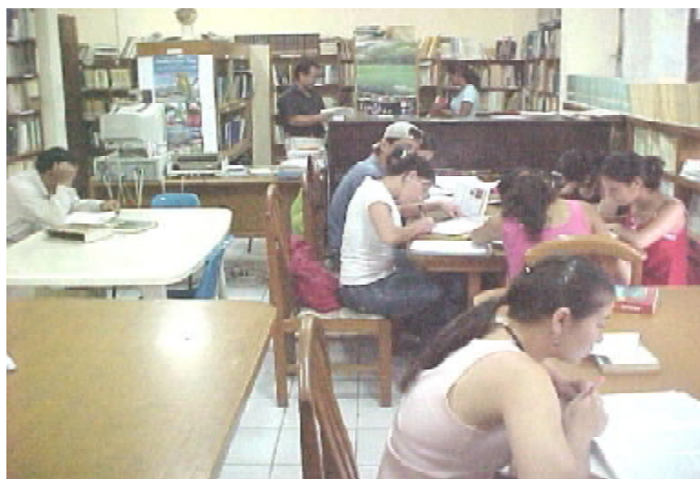
Estudiantes de la Fac. Cs.Agrícolas Investigando temas sobre Recursos Naturales, en la Biblioteca del Museo

La Biblioteca del Museo de Historia Natural "Noel Kempff Mercado, de la Fac. Cs. Agrícolas - U.A.G.R.M., es especializada en Recursos Naturales y Biodiversidad, se encuentra consolidada plenamente en nuestro medio, ya que se halla debidamente afiliada como miembro del Directorio a la RED DE CENTROS DE DOCUMENTACIÓN Y BIBLIOTECAS CRUCEÑAS ESPECIALIZADAS EN CIENCIAS SOCIALES, BIOLÓGICAS E HISTÓRICAS, de Santa Cruz. Los servicios que presta la Biblioteca son: