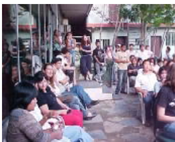
Personal del Museo en el acto central, de celebración del XXII aniversario de la institución

sorpresa, luego compartieron un refrigerio acompañado de horneados típicos; no faltó la buena música y la alegría.