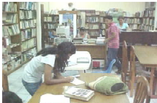
Biblioteca del Museo, al servicio de los estudiantes con más de 7.300 libros

Ecología , Botánica, Zoología, Conservación, Educación Ambiental, Etnias, Áreas Protegidas, Flora y Fauna.