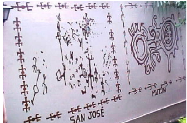
Petroglifos, en los Municipios de San José y el Mutún

La presente exposición son muestras conocidas e investigadas por personas que se dedican al estudio arqueológico del oriente boliviano, con sus recursos propios.