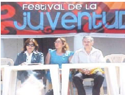
Miembros del directorio de LIDEMA en el Festival de la Juventud y la Feria del Libro Verde

El Museo de Historia Natural Noel Kempff Mercado y La Fundación Integral de Desarrollo – FIDES, instituciones miembros de la Liga de Defensa del Medio Ambiente- LIDEMA, en coordinación con los ECOCLUBES, que articulan acciones de conservación ambiental, organizaron el día 23 de Agosto en la manzana uno de la Plaza 24 de septiembre, la III FERIA DEL LIBRO VERDE. Ésta actividad se realizó en conmemoración a los 23 años de trabajo de la Liga de Defensa del Medio Ambiente (LIDEMA). Ese mismo día, se celebró el Día Internacional de la Juventud (12 de Agosto)