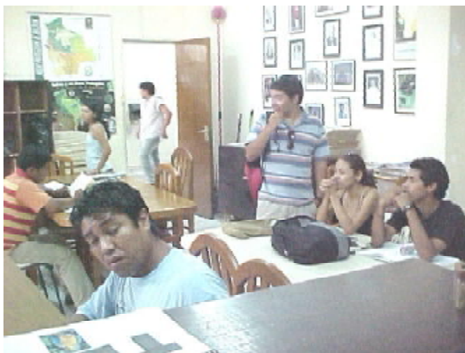
Usuarios en la Biblioteca Especializada del Museo, en Recursos Naturales y Biodiversidad